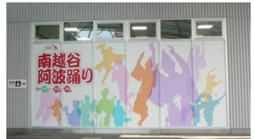
シルエットイラストデザイン

昨年貼付したものに「開催回数」「開催日」部分追加し、開催後は当該部分をはがし、通年で掲示予定。