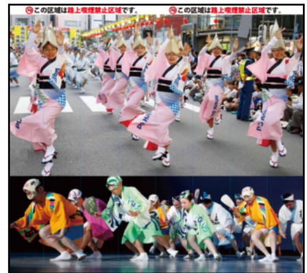
柱巻写真デザイン